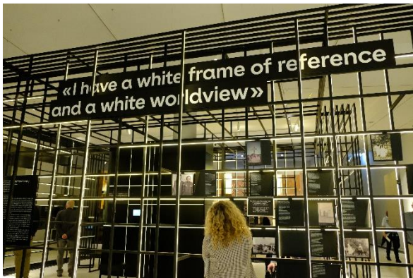
Ausstellungsraum mit Fokus auf Perspektiven zu Inhalten der Ausstellung

Spurensuche Kolonialer Sprengelkiez: Exkursion ins Humboldt-Forum am 29.10.2021 von 17.30-20.30 Uhr